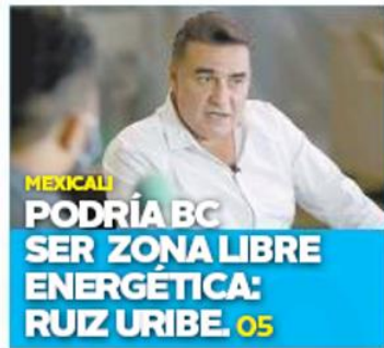
MEXICALI PODRÍA BC SER ZONA LIBRE ENERGÉTICA: RUIZ URIBE.05

DEPORTES AMERICA ALCANZA EL SUBLIDERATO.03